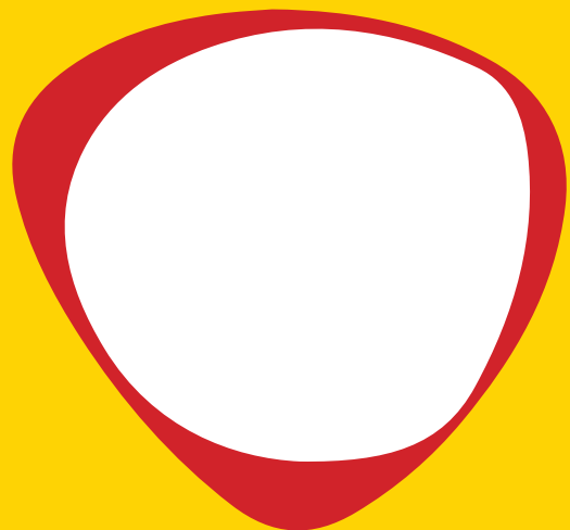
Shenja identifikuese e fëmijës